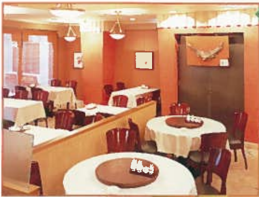
50~60人様 収容のメインダイニング。伝統美と現代的センスがマッチした情緒あふれる空間も個室がご用意する味わいのある空間です。少人数でのご利用からパーティまで、用途に応じてお席をアレンジさせていただきます。