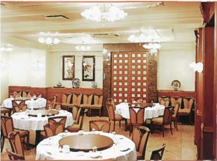
ワンフロア100人様 収容の広々とした本格的パーティースペース。ヨーロッパの伝統を現代感覚で表現したネオクラシズムを基調とした、モダンな空間です。